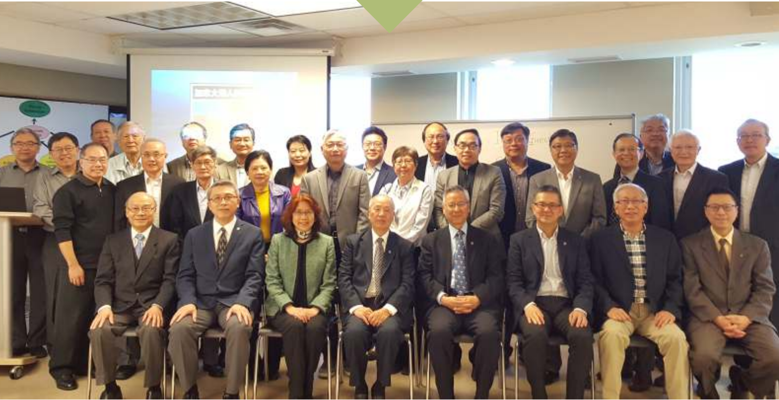
2018加拿大華人神學教育協會董事