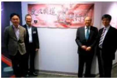
5月份是「加神溫哥華」第一次主辦展覽活動，題目[文以載道·道顯行文]，用幾個中國早期的神學家，來介紹華人基督徒文字工作的傳統與承傳。