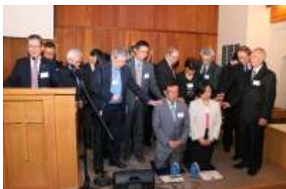
創校3年，今年5月，「加神溫哥華」校區共有兩位畢業生，在第一屆差遣禮上被差遣出去，正式成為全職的事奉工人。