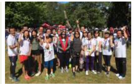
感謝神，今年一共有28位加神師生同工及義工參加Scotiabank溫哥華半馬/5公里競賽。其中24位參加5公里跑步，4位參加半馬跑步。賽事圓滿結束！截止6月20日，學院所收到的奉獻總額為加幣$60,909。衷心感謝每一位支持「加神溫哥華」的牧者和弟兄姊妹。