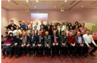
新春感恩聯歡晚宴上，同學們和關心加神的牧長聚首一堂，用膳和遊戲之餘，更彼此數算主恩。